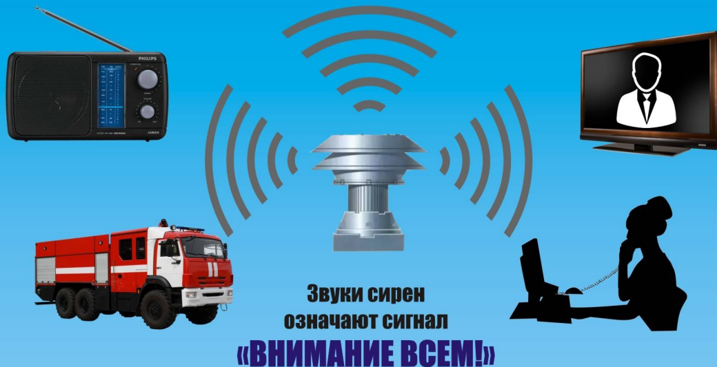
Звуки сирен означают сигнал «ВНИМАНИЕ ВСЕМ!»